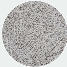
Stein-Grau Stone Grey (SG) RAL 7035*