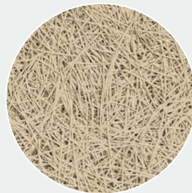
Natürlich gestrichen (NP) RAL 1015*