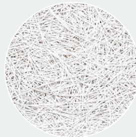
Weiß gestrichen (WP) RAL 9003*