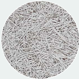
Wolken-Grau Cloud Grey (CG) RAL 7047*